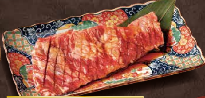
○ ご飯に一番合うカルビ