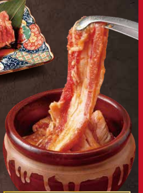
○ 漬け込みヤミツキたれ焼肉