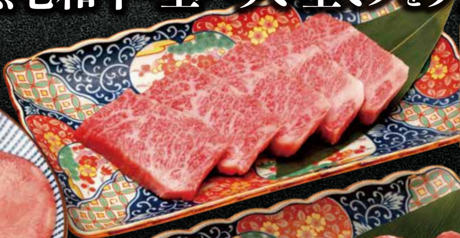
黒毛和牛のどろりカルビ