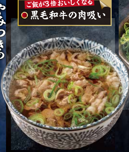
ご飯が3倍おいしくなる ○ 黒毛和牛の肉吸い