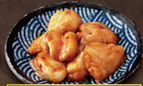
○ 国産牛 感動ホルモン