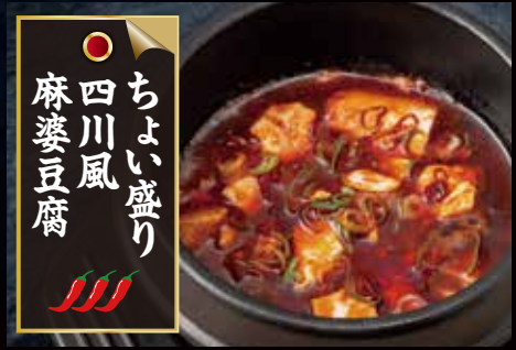
○ ちよい盛り 四川風 麻婆豆腐