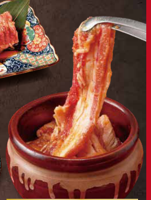
○ 漬け込みヤミツキたれ焼肉