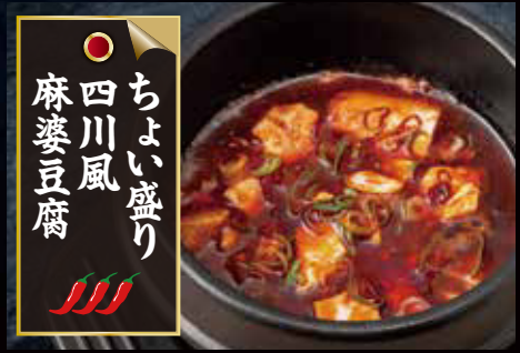
○ ちよい盛り 四川風 麻婆豆腐