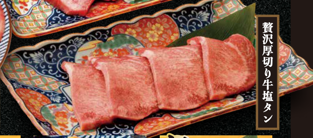
贅沢厚切り牛塩タン