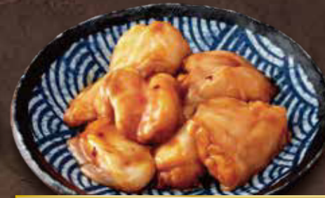
○ 国産牛 感動ホルモン