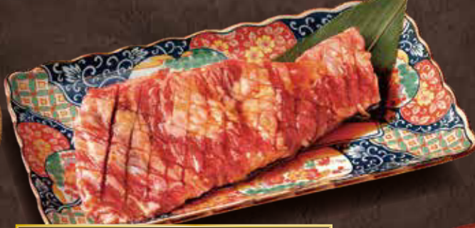
○ ご飯に一番合うカルビ