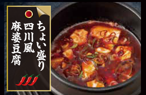
○ ちよい盛り 四川風 麻婆豆腐