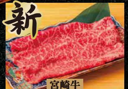
新 至高の10秒ロース