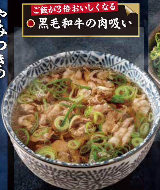
ご飯が3倍おいしくなる ○ 黒毛和牛の肉吸い