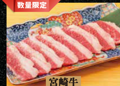
宮崎牛 味わいカルビ