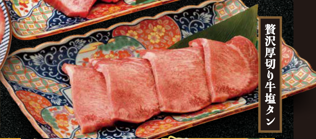
贅沢厚切り牛塩タン